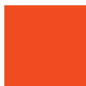
047 Orange red Оранжево-красный