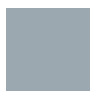
090 Silver grey Серебристо-серый ~RAL 9006