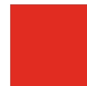
031 Red Красный