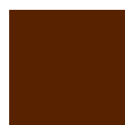
800 Nougat brown Коричневая нуга