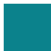
066 Turquoise blue Бирюзово-синий