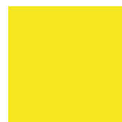
025 Brimstone yellow Серно-желтый ~RAL 1016