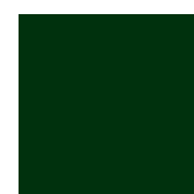
060 Dark green Темно-зеленый ~RAL 6005