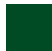
613 Forest green Лесной зеленый