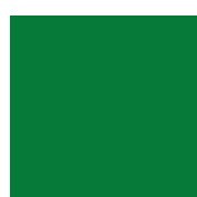
068 Grass green Травянисто-зеленый