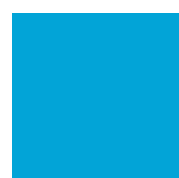
056 Ice blue Светло-голубой