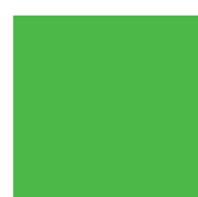
063 Lime-tree green Липово-зеленый