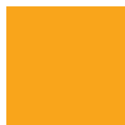
019 Signal yellow Ярко-желтый ~RAL 1003