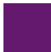
040 Violet Фиолетовый