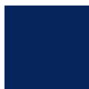
050 Dark blue Темно-синий ~RAL 5013