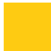
022 Light yellow Светло-желтый