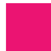
041 Pink Малиновый