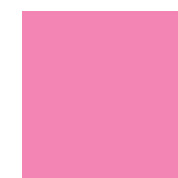
045 Soft pink Светло-розовый