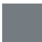
076 Telegrey Серый телеком ~RAL 7045