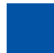
098 Gentian Генциановый