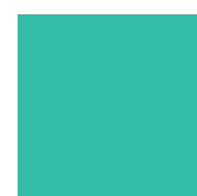
055 Mint Цвет мяты