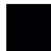
070 Black Черный ~RAL 9005