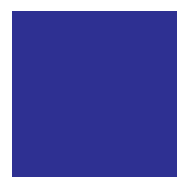
086 Brilliant blue Ярко-синий