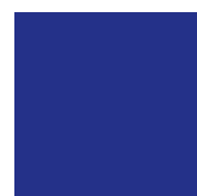
049 King blue Королевский синий