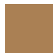
081 Light brown Светло-коричневый