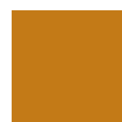
092 Copper Медный